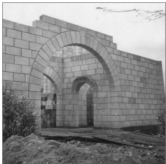
Blick auf das Portal (6)