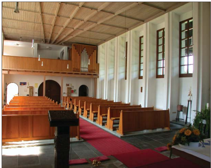
Blick vom Altar auf die Empore. Deulich sieht man die strahlenförmig geordneten Längsbalken der Decke und die schlicht gehaltenen Seitenfenster. (25)