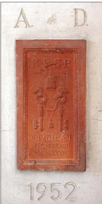
Der Grundstein aus der »Heiligen Pforte« in Rom (23)

1988 erhält das große Chorfenster zum Schutz vor Beschädigungen eine Schutzverglasung.