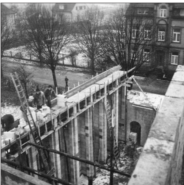
Beim Gießen des Betons waren viele Hände nötig (5)

Die Kirche zu Donrath ist das erste Gotteshaus, das in diesem neuartigen, schönen Stein erbaut wurde.