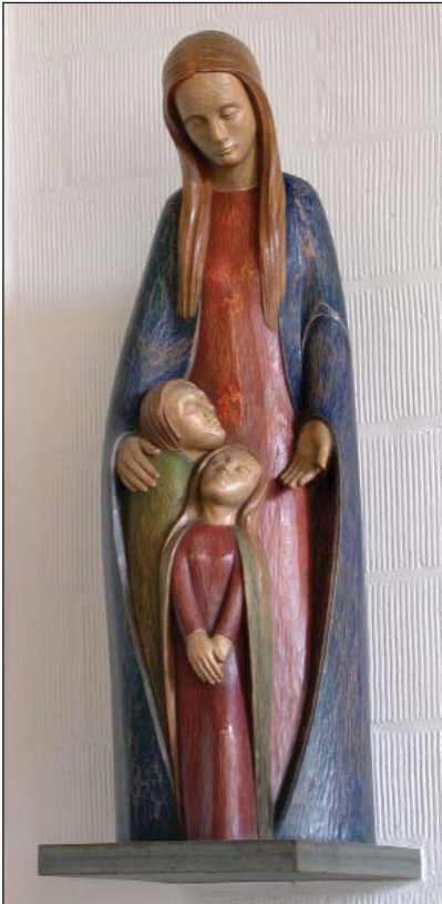
Die Schutzmantel-Madonna von Heinz Bentele (19)

Der Missionskreis Donrath unterstützt die Arbeit der Patres. So wird heute noch am ersten Wochenende im Monat für die Missionsarbeit gesammelt.