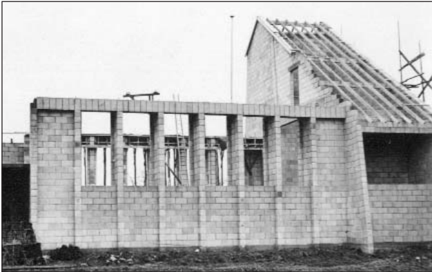
Die südliche Fassade und der Turm (10)