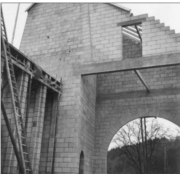
Blick aus dem Kircheninnern auf die noch fensterlose Chorwand und den Turm (8)

Der Baumeister Heinrich Burger verlegte auch den Fußboden.