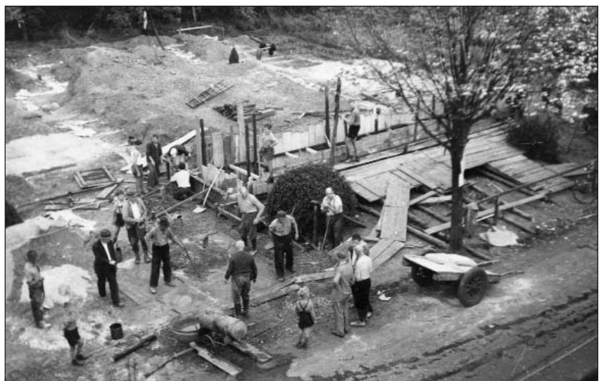
Die Ausschachtungsarbeiten begannen im Sommer 1952 (2)