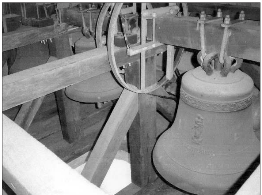
Die Glocken wurden bereits 1955 angeschafft (18)