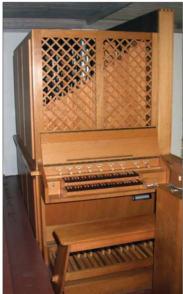
Die Spieltischseite der Orgel (21)

Am 9. September 1984 wird die Aufstellung eines 100 Jahre alten Wegekreuzes, das bis dahin auf dem Lohmarer Friedhof stand, zusammen mit dem 30. Geburtstag der Kirche gefeiert.