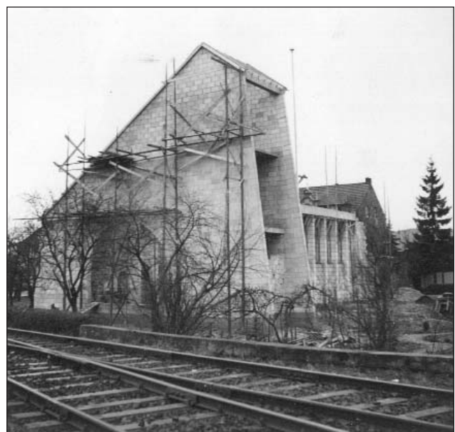
Die Kirche wurde direkt an die Gleisanlage der Bahnlinie Siegburg-Overath gebaut, die 1964 eingestellt wurde. (9)