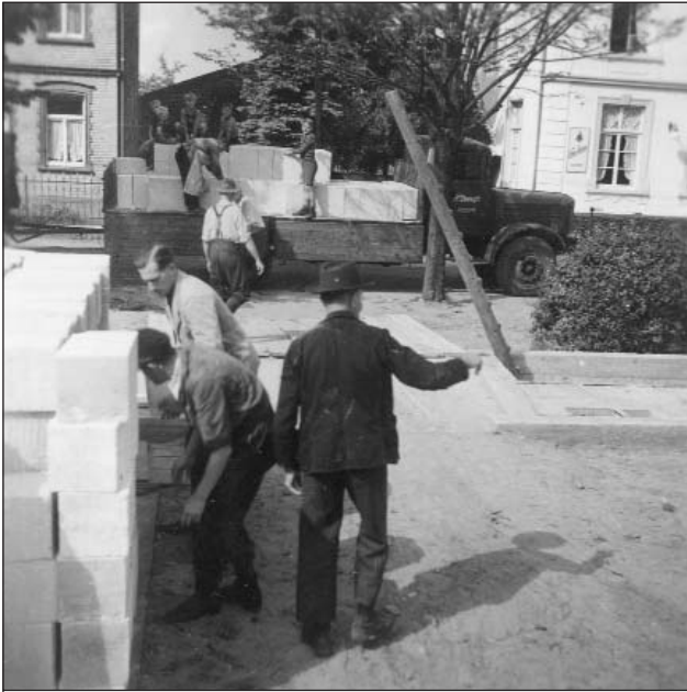
Bald trafen die ersten Steine aus Duisburg ein (3)