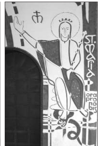
Der Eingang der Marienkirche. Rechts lädt Maria zum Besuch der Kirche, links weist Johannes auf das Lamm hin. (15)