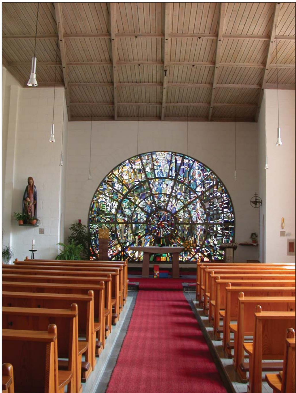
Blick auf das große Chorfenster im Innern der Marienkirche in Donrath (16)

Dem Gedenken der Gefallenen und Vermissten ist das Fenster in der Taufkapelle gewidmet. Es ist eine schlichte, aber vielleicht deshalb sehr wirkungsvolle Gedächtnisstätte, die allgemein Anklang gefunden hat.