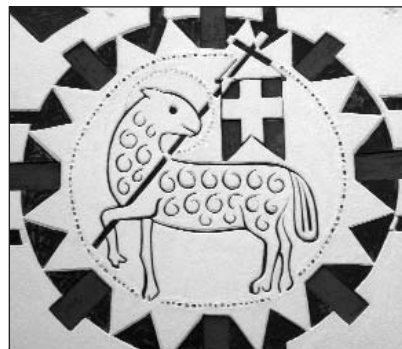
Das Lamm über dem Eingang (14)

Die dem Dorf zugekehrte Längsseite musste besonders freundlich gehalten werden. Der Parkplatz gibt diese Seite dem Blick des Beschauers ganz frei. Durch das nahezu 54 qm große Turmfenster und das heruntergezogene Dach