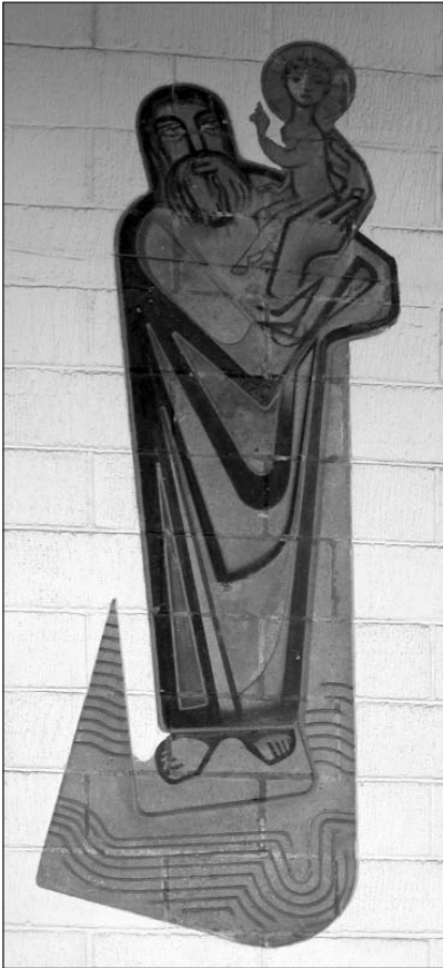
St. Chrisphorus an der Nordwand (17)

Die Figur des Christophorus, eine äußerst gelungene Sgraffito-Arbeit an der nördlichen Außenwand, wurde von Ulrich Bliese geschaffen.