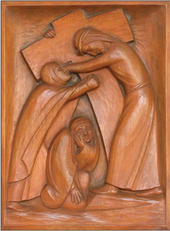
Die 8. Station des Kreuzwegs (22)

1986 wird die Orgelbühne erweitert, die Orgel selbst versetzt und eine fällige Generalüberholung durchgeführt.