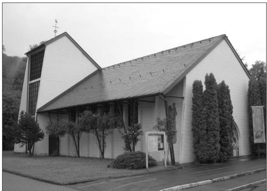
Marienkirche in Donrath (1)

Als die Gefahren des Krieges vorüber waren, war den Donrathenern die Sonntagsmesse in ihrem eigenen Dorf so lieb geworden, dass sie nicht mehr in nennenswerter Zahl zur Pfarrkirche in Lohmar gelockt werden konnten. Auch lagen die Fahrzeiten der Züge jetzt nicht mehr so günstig wie vordem. Man kam zu spät zur hl. Messe und hatte nachher eine längere Wartezeit. Außerdem hatte der Verkehr auf der Donrath mit Lohmar verbindenden schmalen Straße an den Sonntagen derartige Formen angenommen, dass sie nur unter Gefahr zu begehen war.