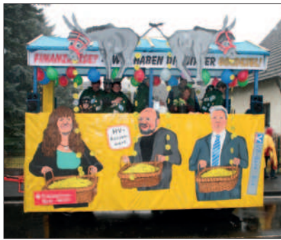
Die Goldesel füllen unsere Kassen!

29.11.2008 Adventsmarkt in Heide : Einige Heider Bürger veranstalten mit Unterstützung des HV einen Adventsmarkt mit kleinen Verkaufsständen, Grill und Getränken, Singen der Chöre und dem Auftreten des Nikolauses für die Kinder. Eigentlich eine sehr schöne Veranstaltung. Leider kamen in den Folgejahren immer weniger Besucher aus Heide, so dass diese Veranstaltung eingeschlafen ist. Schade!