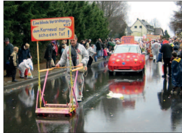
Erfolg von Roters „Anti-Kulturerlass“

21.09.2003 Herbstausflug zur Müngstener Brücke und zu einem Open-Air-Theater in Schloss Burg