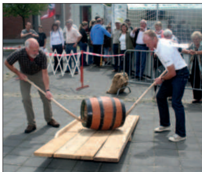
Fassrollen auf der Birker Kirmes

13.06.2009 Freischneiden der Ruhebänke : Sie fallen nur auf, wenn sie zerstört oder zugewachsen sind. Der HV hat ca. 40 Ruhebänke aufgestellt. Ihre Pflege ist eine Standardaufgabe.