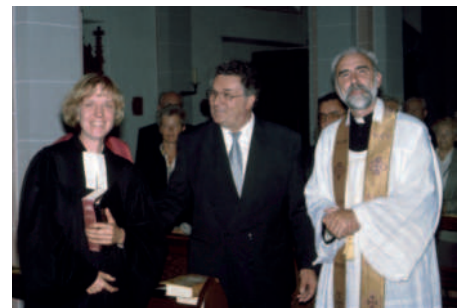
75.-HV-Jubiläum: Ökumen. Festgottesdienst

23.09.1995 Besichtigung Steyler Mission in St. Augustin