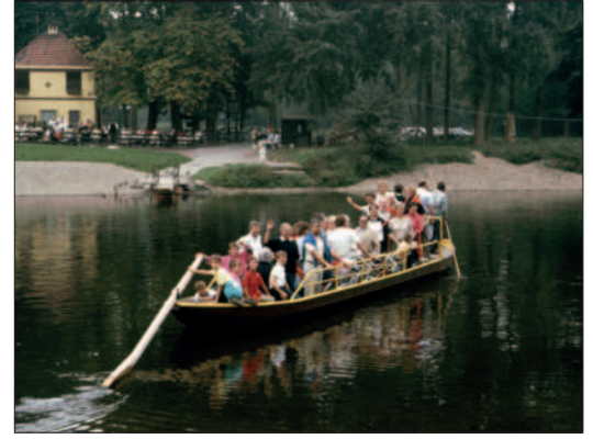
Fährrfahrt über die Sieg

11.09.1988 Herbstwanderung: Wir fahren mit Busunterstützung zur unteren Sieg und wanderten zu der Stelle, an der die Sieg in den Rhein fließt. Auf dem Weg zur Gaststätte „Zur Siegfähre“ überquerten wir die Sieg mit der dortigen Fähre.