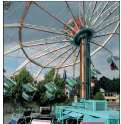
Kirmes in Birk

Juli 2004 Unser HV veranstaltet jedes Jahr die „ Klein “-Kirmes in Birk: Gerd Albus gelang es, die Kirmes für die Schausteller und Besucher immer attraktiver zu gestalten. So wurde auch der Platz vor dem Bürgerhaus mit größeren Fahrgeschäften mit einbezogen.