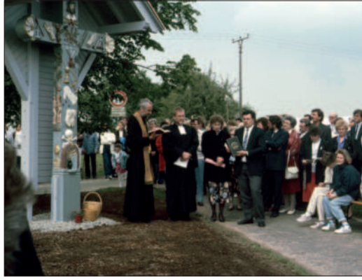
Ökumenische Einweihung des Algerter Kreuzes