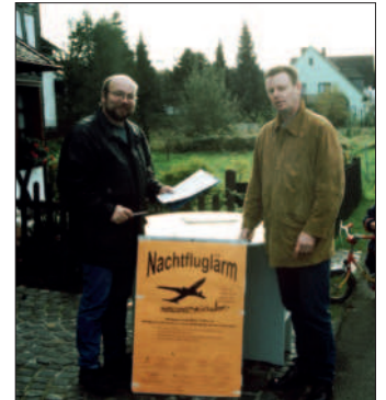
Unterschriftenaktion gegen Nachtflug

März 2001 Auf Einladung des Eppendorfer Heimatvereins unternahmen wir eine 4-tägige Busfahrt zur Partnerstadt Eppendorf . Auf dem Programm standen Besichtigungen von Weimar, Dresden, Freiberg, der Augustusburg, Erfurt und natürlich das Feiern mit den Eppendorfern.