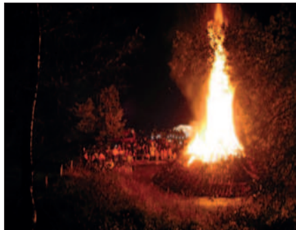
Das St.-Martinsfeuer in Heide

09.04.2005 Immer wieder Arbeiten an der Schutzhütte : Säubern und reparieren.