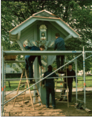
Aufstellung des Algerter Kreuzes