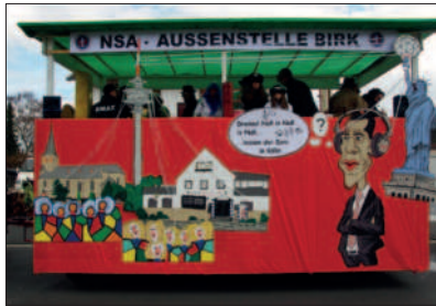
NSA – Außenstelle HV-Birk

17.05.2013 Es war schwer, einen Termin zu bekommen, jetzt hatten wir einen zur Besichtigung des Siegwerkes . Es war interessant, durch die Produktionshallen und das Museum geführt zu werden.