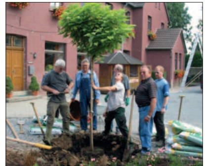
Wir pflanzen den Trompetenbaum in Breidt

05.06.2005 Wir fahren zur Landesgartenschau in Leverkusen