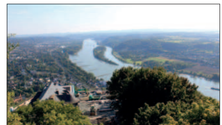
Blick vom Drachenfels

06.07.2012 Kirmes bei schönem Wetter: Die Kinder hatten ihr Vergnügen.