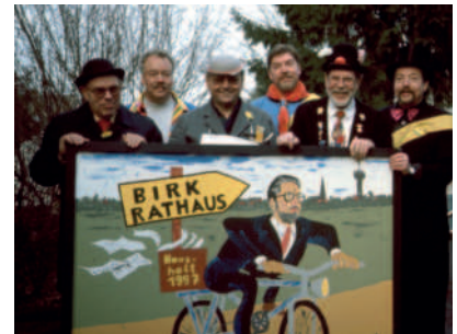
Forderung an Bürgermeister Schöpe: „Rathaus nach Birk“

13.10.1996 Die Herbstwanderung führte uns auf den Rotweinwanderweg ins Ahrtal und endete in einem Rotweinlokal.