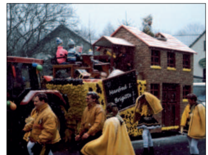
Der Prinzenwagen des Heimatvereins