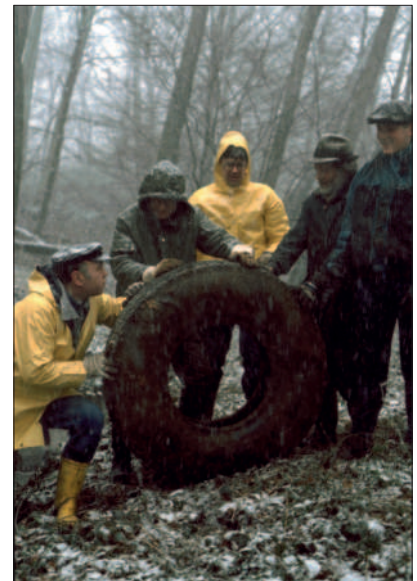
Reinigung im Jabach-Siefen

Juni 1992 Teilnahme an einem Besuch in der Partnerstadt Frouard-Pompey