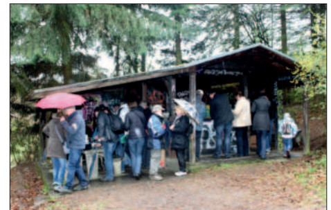
Osterwanderung zu Schutzhütte

09.04.2012 Unsere Osterwanderung führte zu der Schutzhütte. Dort machten wir eine gemütliche Pause. Danach ging es zurück zum Ausklang in der Gaststätte Fielenbach. Trotz des Regens hatten wir eine gute Beteiligung.