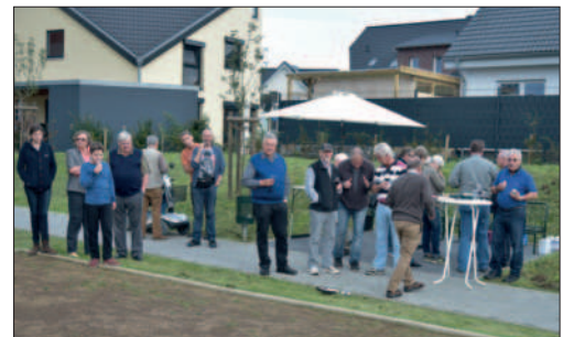
Das 1. Boule-Turnier

04.03.2014 Einmal müssen doch Möhnen gezeigt werden: Seit Urzeiten klingt die Karnevalssession bei uns mit dem Möhneball aus. Mit einem bunten Programm und der Prämierung der besten Möhnen erleben wir die letzten Stunden vor dem Aschermittwoch. Den Möhneball veranstalten wir seit einigen Jahren zusammen mit dem Ortsring.