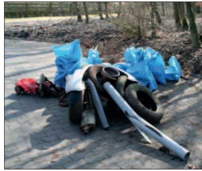
„Lohmar fegt los“