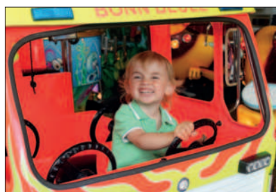
Kirmes macht Spaß!

06.07.2012 Kirmes bei schönem Wetter: Die Kinder hatten ihr Vergnügen.