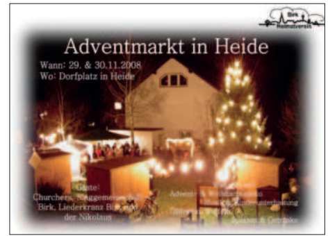
Adventmarkt in Heide

22.02.2009 Wer erinnert sich noch an den großen internationalen Finanzcrash 2008? Der HV hat für unseren Bereich eine gute Lösung gefunden. Die beiden Esel der Familie Hülse, die hinter dem Friedhof grasen, werden zu Goldeseln umfunktioniert und füllen die Kassen der VR-Bank, des HV und der Kreissparkasse. – Zu mindestens auf dem HV-Karnevalswagen: „ Finanzkrise und Goldesel “