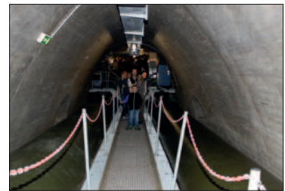
Unter dem Wahnbach-Staudamm

22.09.2013 Herbstwanderung: Nach 23 Jahren haben wir wieder eine Besichtigung des Wahnbach-Staudamms durchgeführt. Wie damals war das Interesse groß und die Führung sehr interessant.