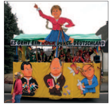
Karnevalswagen: „Es geht ein Rock durch Deutschland“

24.09.2006 Wieder war ein größerer Herbstausflug angesagt: Wir fahren nach Koblenz und besichtigen die Festung Ehrenbreitstein. Vom Deutschen Eck fahren wir nach Birk zurück.