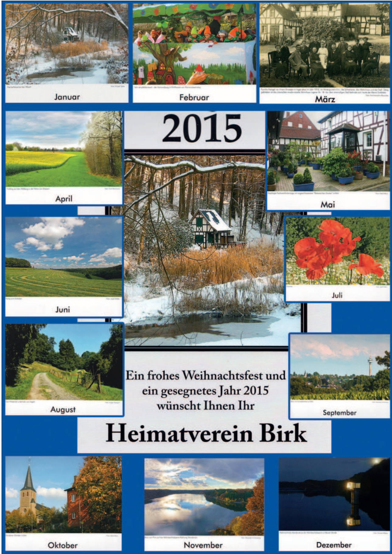
Der HV-Kalender 2015