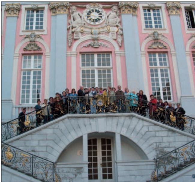
Besuch des Bonner Rathauses

Okt. 2002 Mit dem Bus kamen Eppendorfer zu einem 4-Tage- Gegenbesuch zu uns. Fröhlich feierten wir. Auf dem Programm stand auch eine Besichtigung der Stadt Bonn.