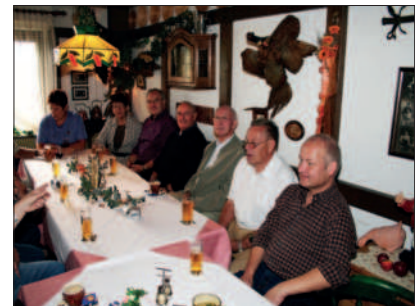
Ausklang der Herbstwanderung bei „Fielenbach“