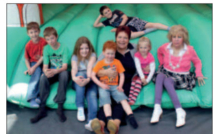
Hüpfburg beim Maiansingen

16.09.2012 Mit Bus, Bahn und Zahnradbahn fuhren wir bei dem Herbstausflug zum Drachenfels hoch und genossen die phantastische Aussicht.