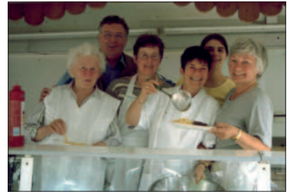
Helferinnen beim Maiansingen