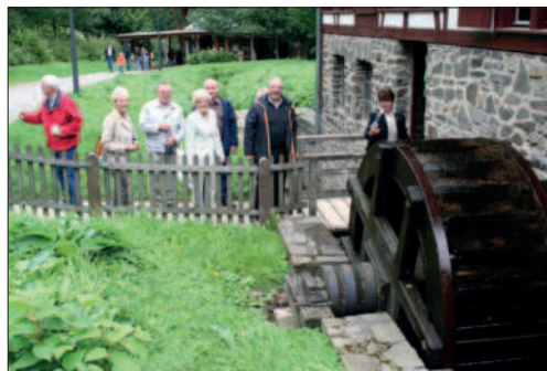
Freilichtmuseum: Das alte Wasserrad

April 2008 Im Rahmen der „ Lohmarer Kulturtage “ organisiert der HV die Veranstaltungen zur Heimat- und Brauchtumpflege.