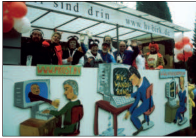
Motto des HV-Karnevalswagens: HV im Internet“

05.03.2000 Wir haben jetzt eine Homepage! Sie gibt das Motto für den Karnevalswagen: „ HV im Internet “ (www.heimatverein-birk.de)