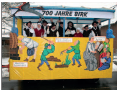
700 Jahre Birk

21.02.2010 Vor 700 Jahren wurde Birk zum ersten Mal urkundlich erwähnt. Das musste der HV gebührend feiern! Zunächst stand der HV-Karnevalswagen natürlich unter diesem Motto. Exakt auf den Jubiläumstag fand dann die große 700-Jahr-Feier mit einem ökumenischen Gottesdienst und einem Festkommers statt. Am 10. September hängten wir im Bürgerhaus eine Kopie der Urkunde mit Erklärungen auf.