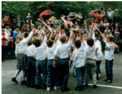
Auftritt der Grundschule Birk beim Maiansingen

29.06.1996 Leider müssen wir unseren Lagerraum im Keller der Grundschule räumen.