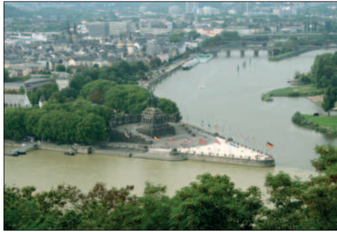
Blick von der Festung Ehrenbreitstein auf das Deutsche Eck.