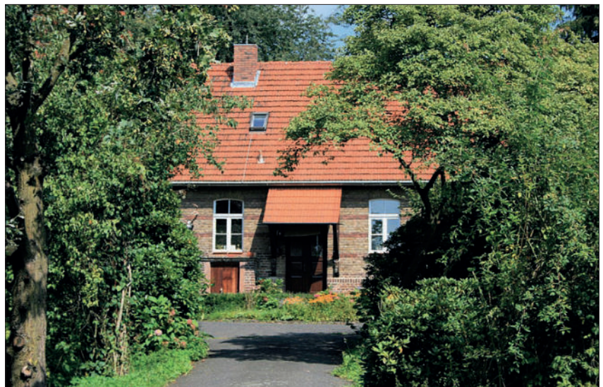
Baudenkmal Nr. A 27 der Stadt Siegburg; Forstdienstgebäude Aulgasse; Steinbahn 24 (7)