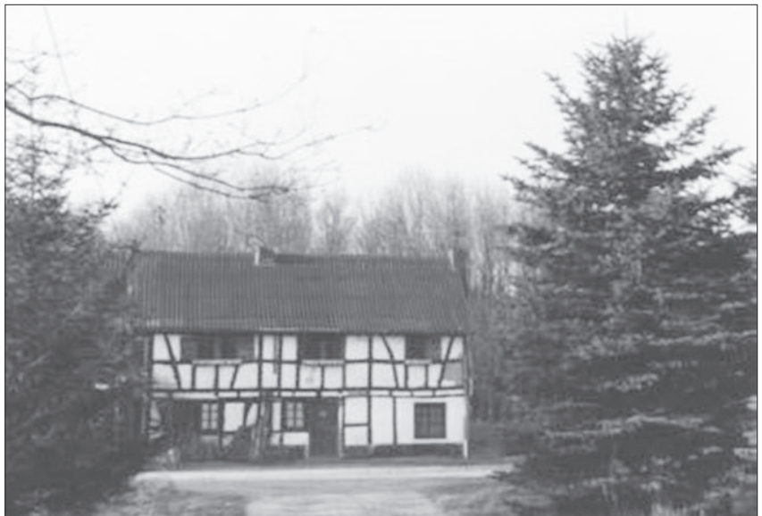
Das Fachwerkgehöft, der Rothenbacher Hof, Wohn- und Wirtschaftsgebäude, Zustand 1980/1989 (9 a u. 9 b)