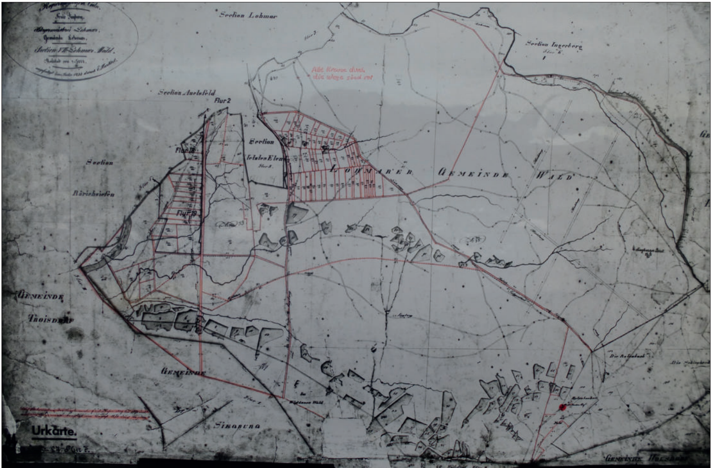
Kataster-Uraufnahme in den Jahren 1822-24, der Flur VII, genannt „Lohmarer Wald“, links von dem Gehöft Rothenbacher Hof [roter Punkt] erkennt man einige von ehemals insgesamt 72 Weihern (4)