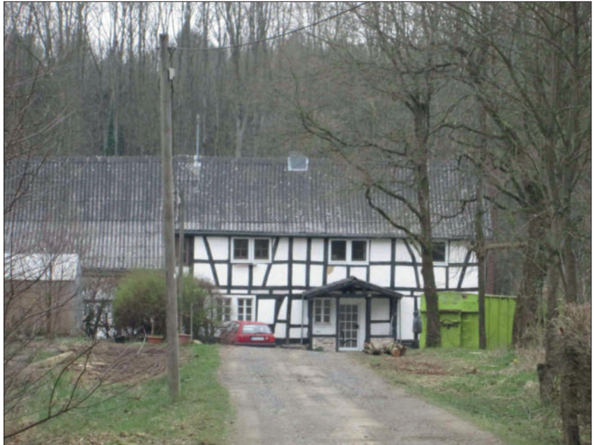
Das Fachwerkgehöft, der Rothenbacher Hof, Wohn- und Wirtschaftsgebäude, Foto 2014 (9)

Heute ist das Fachwerkgehöft Rothenbacher Hof von der Liegen-